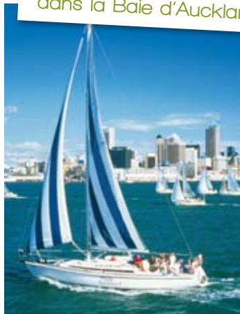
Croisière en catamaran dans la Baie d'Auckland