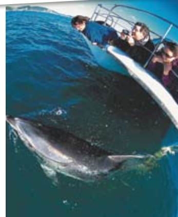
Rencontre et nage avec les dauphins dans la Baie des Îles (palmes, masques et combinaisons fournis)