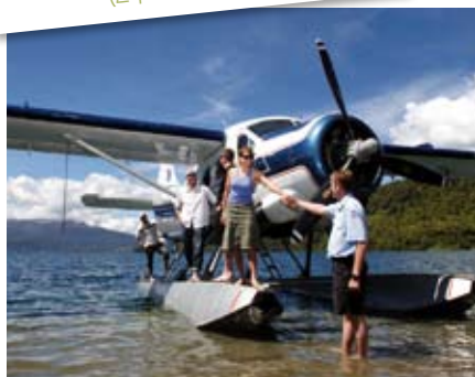
Survol du Mont Tarawera (2 pers. minimum)

Nage avec les dauphins : 35 Nzd à payer sur place